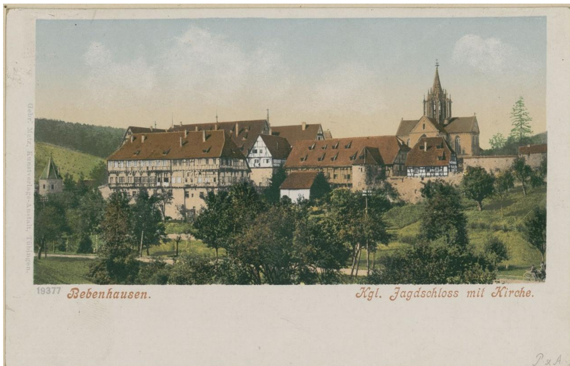
Kloster Bebenhausen, Außenansicht

Die Abgeordneten von Württemberg-Hohenzollern versammeln sich im ehemaligen Zisterzienserkloster Bebenhausen (Winterrefektorium) bei Tübingen. Es dient im 19. Jahrhundert zeitweise als königliches Jagdschloss.