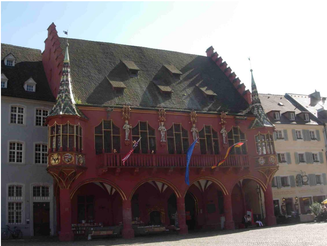
Kaufmannshaus Freiburg / Breisgau