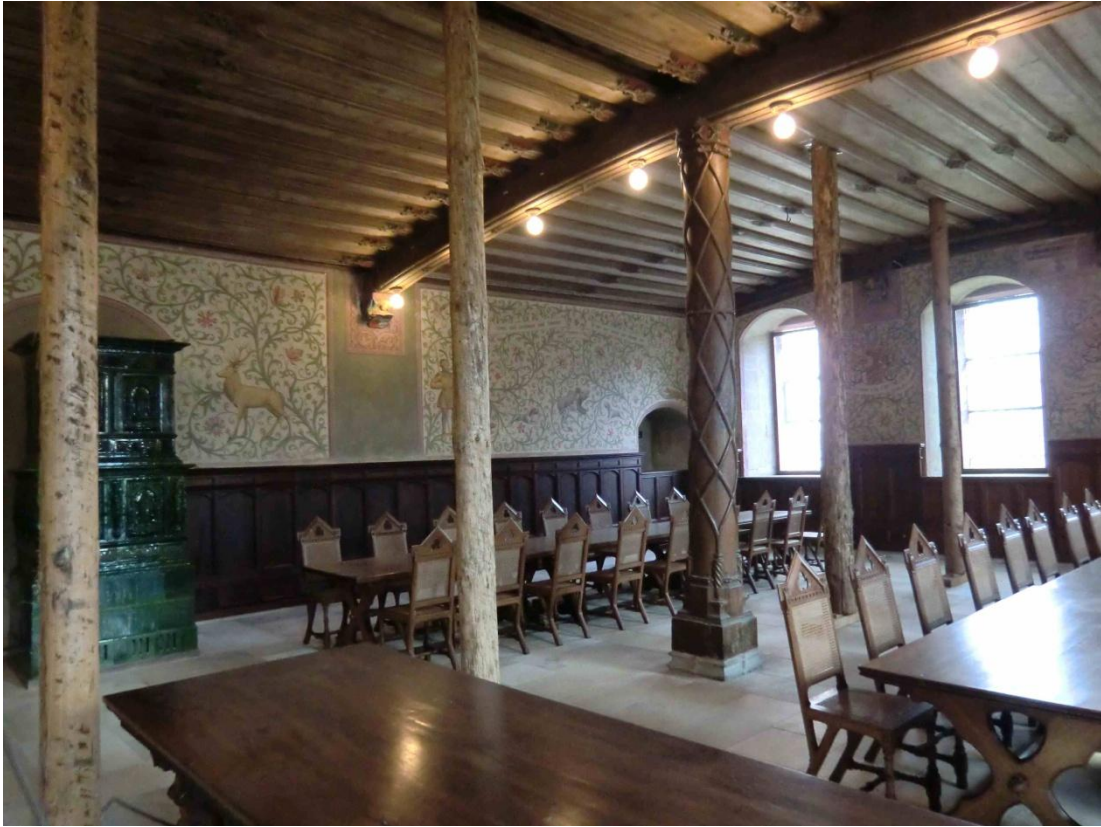
Kloster Bebenhausen: Winterrefektorium