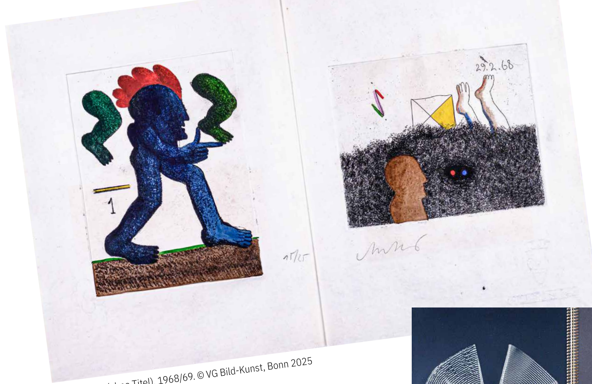
Horst Antes: (ohne Titel), 1968/69. © VG Bild-Kunst, Bonn 2025

In Büchern stehen in erster Linie Buchstaben und durch Lesen und Nachdenken lässt sich ein Buch erfassen. Das gilt für die meisten Werke in der Württembergischen Landesbibliothek Stuttgart und ist kaum der Rede wert. Die Ausstellung zeigt jedoch, dass sich manche Bücher diesem Ansatz verschließen oder weit darüber hinausgehen. Seiten sind nicht zwingend mit Lettern bedruckt – sie können ebenso mit Druckgrafiken, Nägeln, Folien oder Aluminium bearbeitet sein.