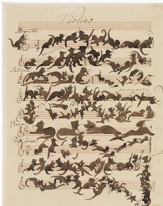
Moritz von Schwind: Die Katzen- symphonie, 1868. Staatliche Kunsthalle Karlsruhe