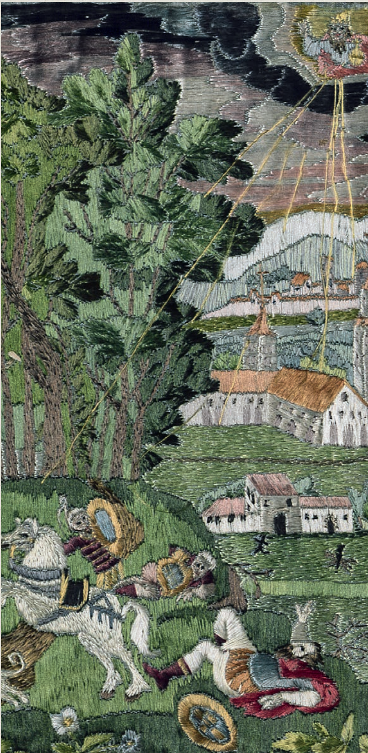
Seidenstickerei: Paulus vor Damaskus, 1603